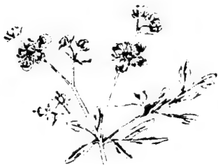
نسرين Ruta Graveolens

تتطلب خبرة سابقة باستعمال الأوراق الطازجة التي هي أسهل من استعمال الأوراق الجافة المسحوقة.